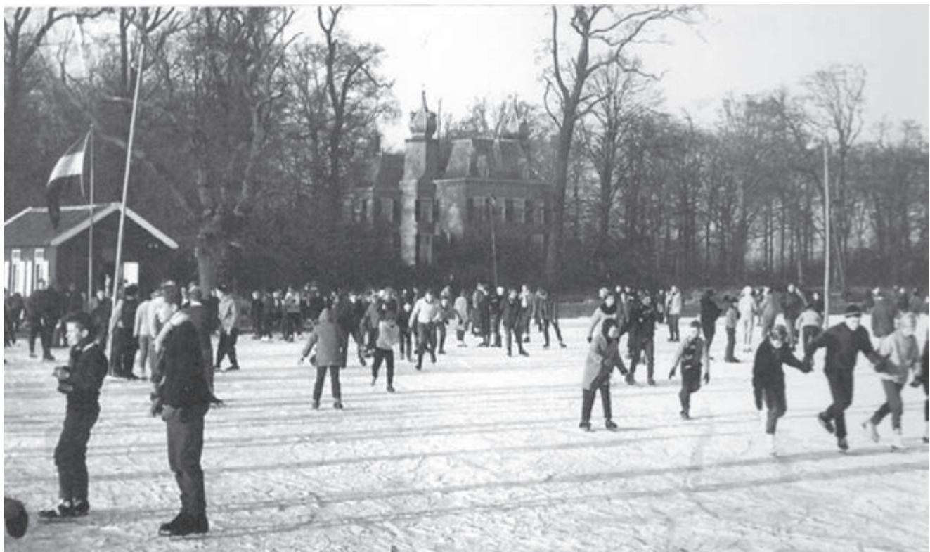
De ijsbaan in 1961 met het kasteel Oud-Poelgeest op de achtergrond en links de kantine met kleedkamers, die in 1968 is afgebrand.

In november 1940 gaf de gemeente toestemming aan de IJclub Oegstgeest om het stuk weiland achter kasteel Oud-Poelgeest te benutten als ijsbaan: de Ezelswei in de Kikkerpolder. De baan ging in de winter van 1940-1941 al deels open, maar de officiële opening was op 13 januari 1942 door voorzitter M.J. Swart en burgemeester A.J. van Gerrevink. De zogenaamde ijsbaan Poelgeest was met een grootte van 24000 vierkante meter toen de grootste ijsbaan van Zuid-Holland, maar zij was wel primitief: er was geen verlichting en geen duidelijke afrastering. Bezoekers konden in een consumptietent warme dranken kopen en er was een muziekinstallatie. In september 1942 moesten alle ijsverenigingen zich op bevel van de Duitse bezetters aansluiten bij de Nederlandsche Schaatsbond, om beter overzicht op alle clubs te krijgen. Het is niet bekend of de IJclub Oegstgeest zich heeft aangesloten; in elk geval zijn er in 1943-1945 geen activiteiten meer op de ijsbaan geweest. De vereniging vierde op 16 januari 1943 wel het vijftigjarig bestaan met een receptie in hotel Het Witte Huis.