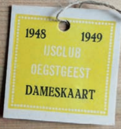
Ledenkaarten van IJsclub Oegstgeest door de jaren heen.