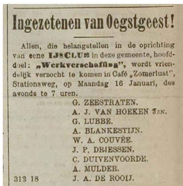
Advertentie in het Leidsch Dagblad van 16 januari 1893. Deze oproep leidde tot de oprichting van de Ijsclub Oegstgeest.