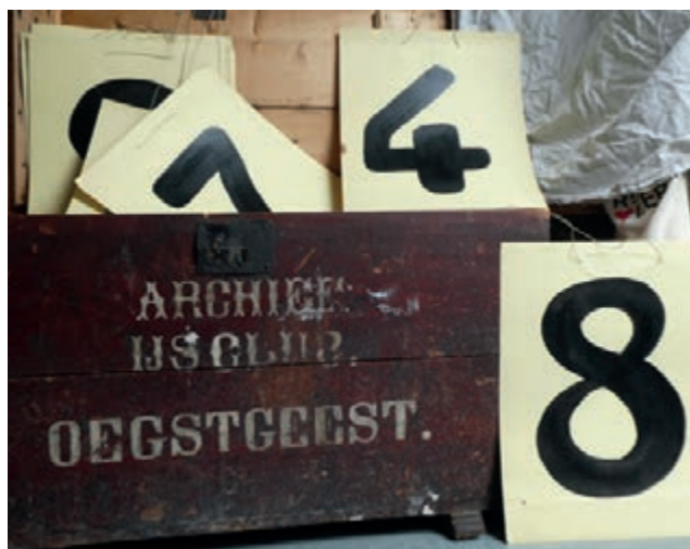
De historische Archiefkist van de Ijsclub Oegstgeest met enkele van de 16 nummers, uitgereikt aan baanvegers voor het markeren van het baanvak waarvoor elk verantwoordelijk was (jaren '20 en '30).

In de Leidse regio is de Leidsche Studenten Ijsclub uit 1866 waarschijnlijk de eerste ijsclub. Deze organiseerde wedstrijden op het ijs van het Galgewater, dat toen nog op de grens van Oegstgeest en Leiden lag. In de volgende jaren werden de Ijsclub Leiderdorp en Zoeterwoude (1885),