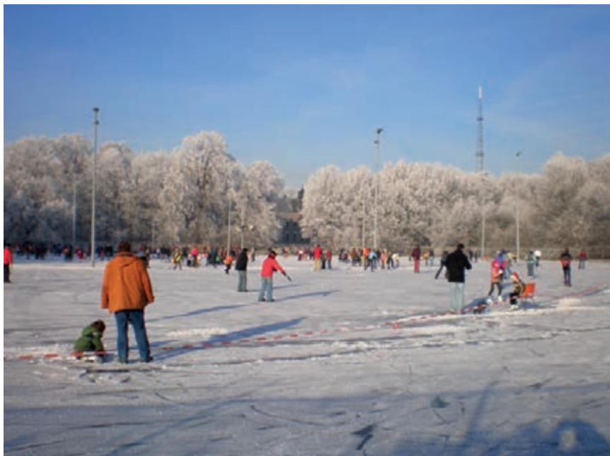
Een kleurrijke blik op de ijsbaan op 22 december 2007.