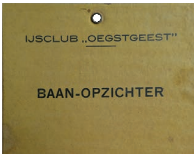
Baanopzichtersbadge (jaartal onbekend).